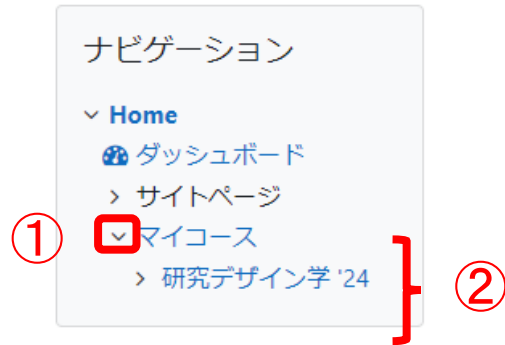
図 4 マイコース